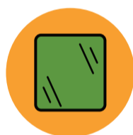
Vidro 4 dias