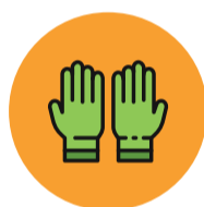
Luva Cirúrgica 8 horas