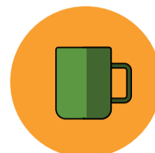
Objetos ou superfícies contaminadas