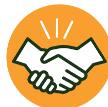
Toque ou aperto de mãos