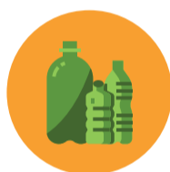
Plástico 5 dias