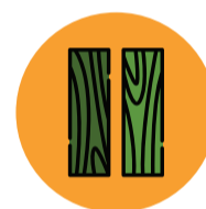
Madeira 4 dias