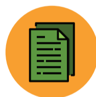
Papel 4 a 5 dias