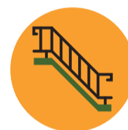
Aço 48 horas