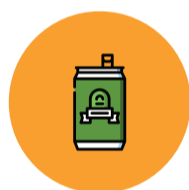
Alumínio 2 a 8 horas